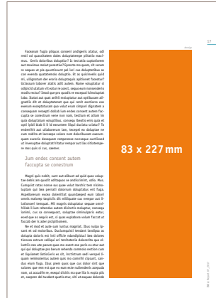
1/2 Seite hoch 83 x 227 mm