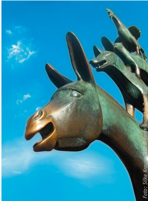
7. StraÙe