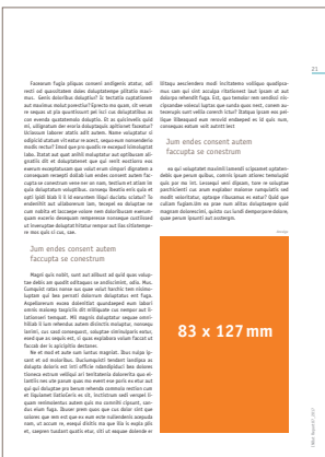
1/4 Seite hoch 83 x 127 mm