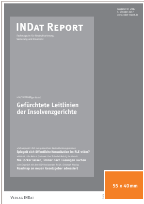
U1 Titelanzeige 55 x 40 mm