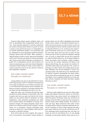
Störeranzeige 53,7 x 40 mm