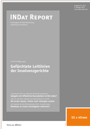
U1 Titelanzeige 55 x 40 mm