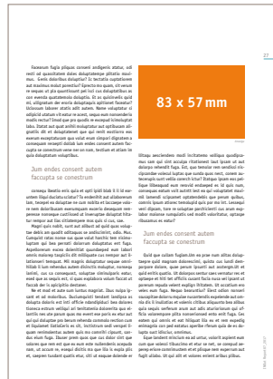
1/8 Seite quer 83 x 57 mm