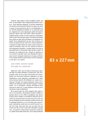
1/2 Seite hoch 83 x 227 mm