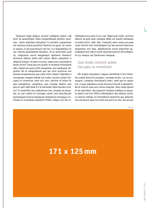
1/2 Seite quer 171 x 125 mm