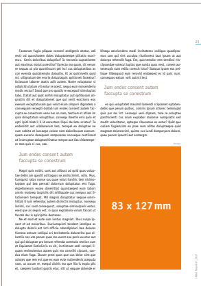
1/4 Seite hoch 83 x 127 mm