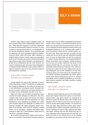
Störeranzeige 53,7 x 40 mm