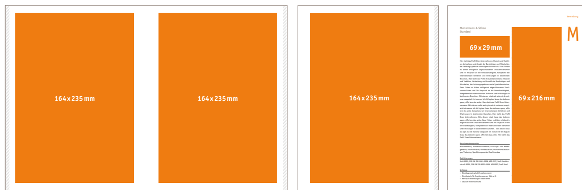
2 x 1/1 Seite Innen 2 Dateien á 164 x 235 mm