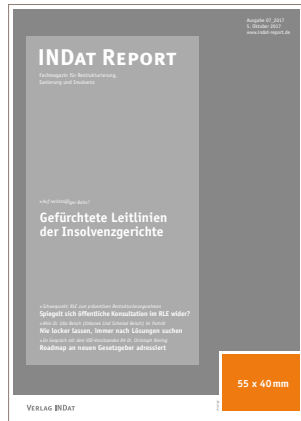
U1 Titelanzeige 55 x 40 mm