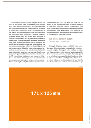
1/2 Seite quer 171 x 125 mm