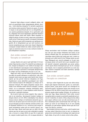
1/8 Seite quer 83 x 57 mm