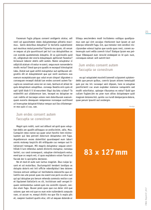
1/4 Seite hoch 83 x 127 mm